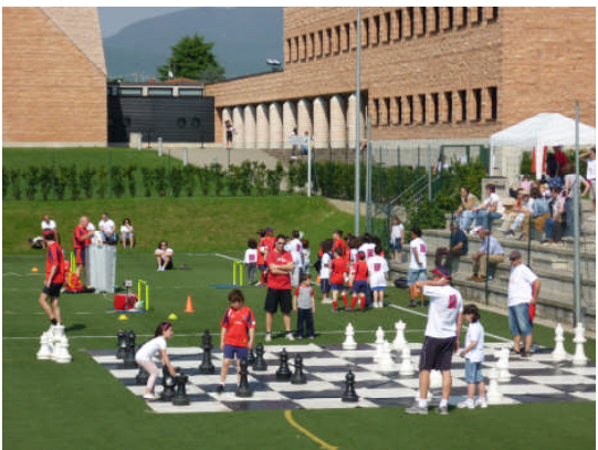
Percorso "GIOCORUGBY" 3 Maggio 2009