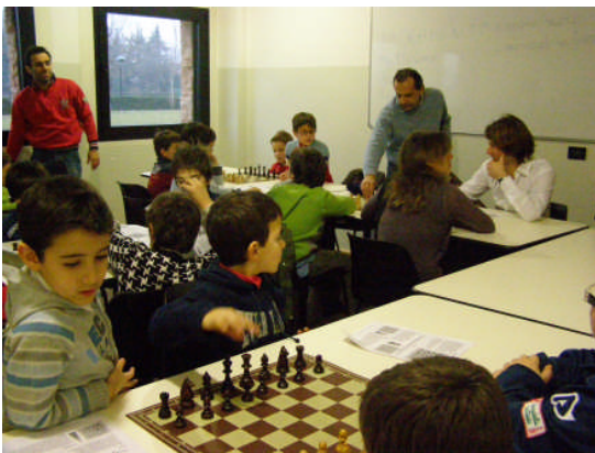
Corso Scacchi 24 Gennaio 2009